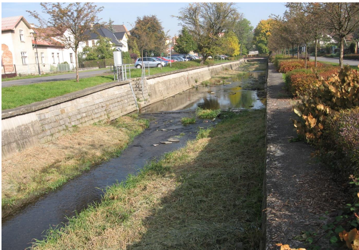
Velička, Hranice sečení obou břehů